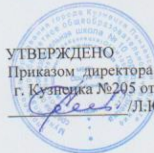
График проведения оценочных процедур в МБОУ СОШ №10 города Кузнецка 2023-2024 учебный год